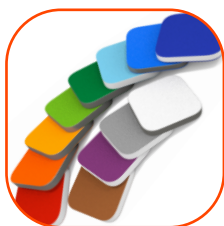
Elementy z kolorowego trójwarstwowego polietylenu hdpe o grubości 15 mm