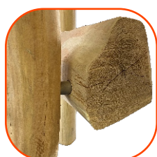
Naturalne drewno robinii akacjowej