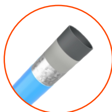
Elementy ze stali czarnej cynkowanej proszkowo i malowanej proszkowo.